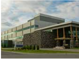
École de médecine du Nord de l'Ontario Université Laurentienne

935, chemin du lac Ramsey Sudbury ON P3E 2C6