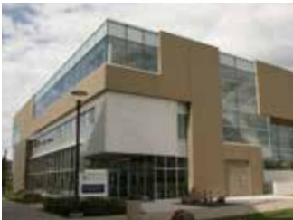
École de médecine du Nord de l'Ontario Lakehead University

Téléphone : +1-705-675-4883 Télécopieur : +1-705-675-4858